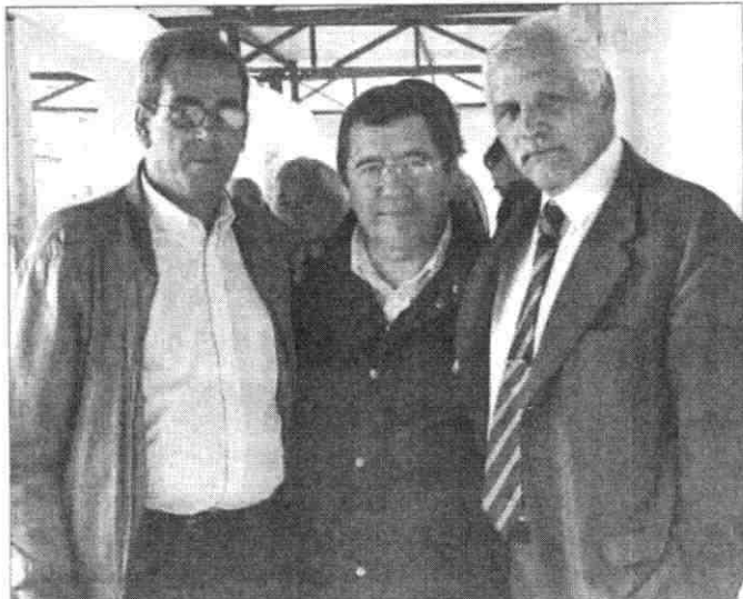
Sintrense é um clube que mantém fortes ligações com outros emblemas da região