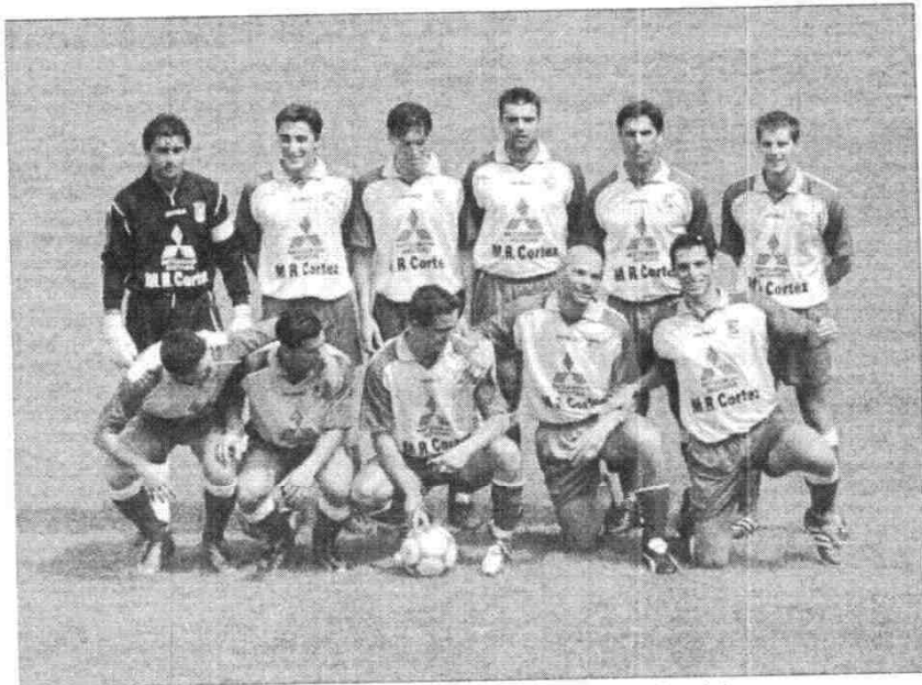
Sintrense tem razões de sobra para encarar o campeonato de 2002/2003 com grande optimismo